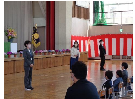
わくわくどきどきの担任発表