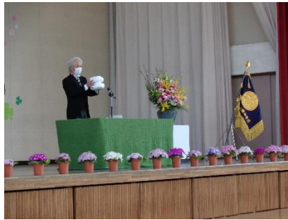
校長先生のお話をしっかり聞けました！